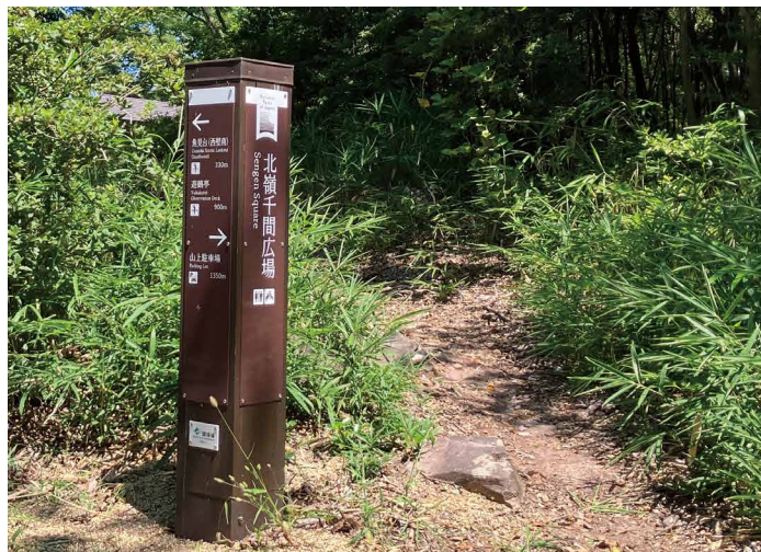
表示板サイズ：W160xH800 表示方法：スーパーカラー BR110 印刷