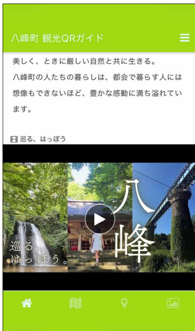
ホーム画面にはPR動画が埋め込んであります (視聴には通信が必要です)。