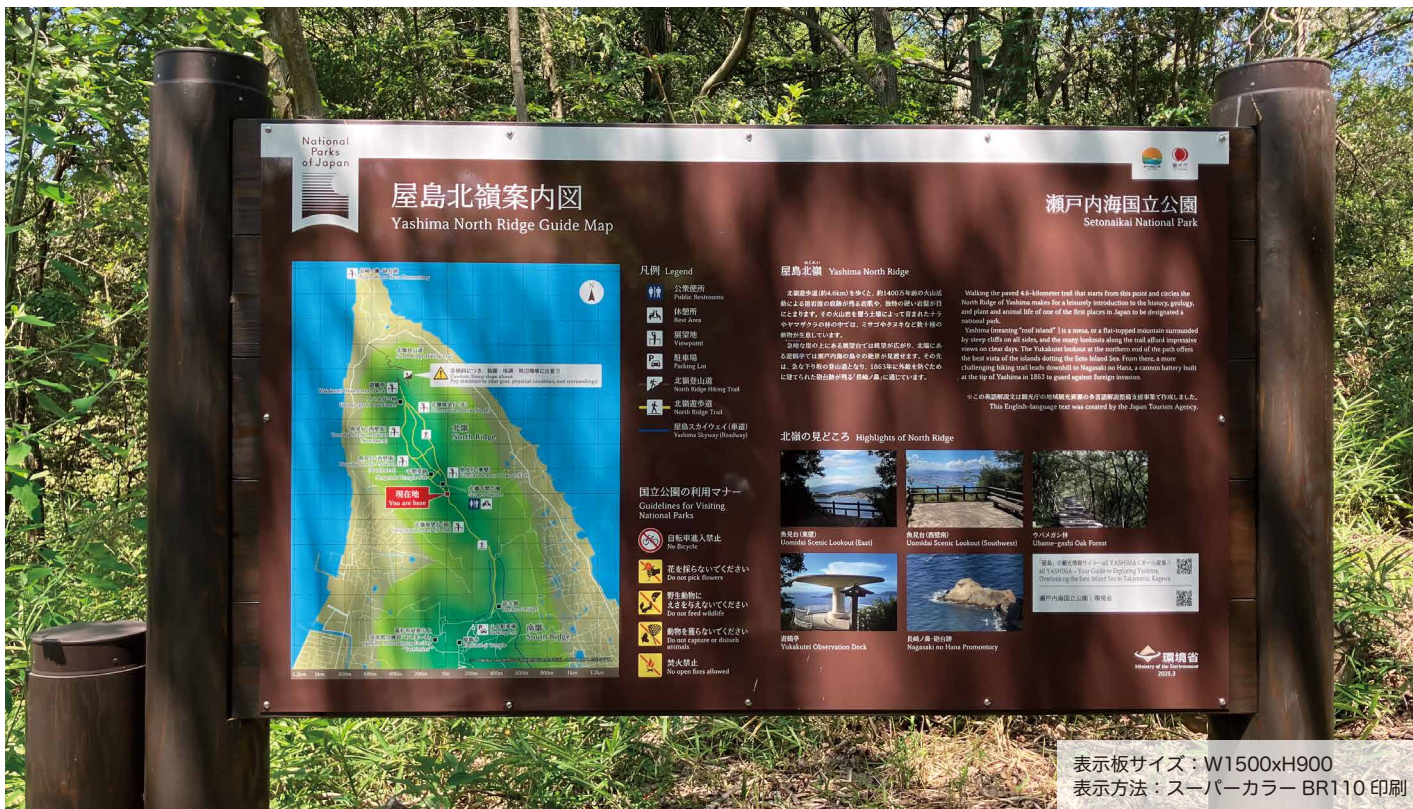
表示板サイズ：W1500xH900 表示方法：スーパーカラー BR110 印刷