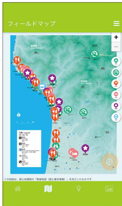
GPS 連動マップは八峰町全域を掲載し、みどころスポットをジャンルに分けたアイコンで表示しています。