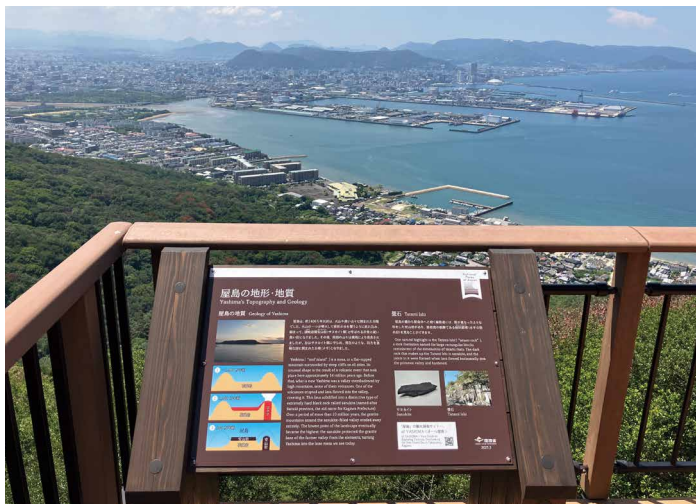
表示板サイズ：W880xH580 表示方法：スーパーカラー BR110 印刷